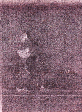
▲ 淀殿像 (養源院蔵)